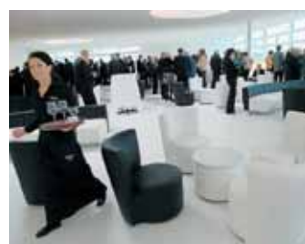
Treffpunkt Skylobby: Die Gastronomie in der 5. Etage des Theaters hat ihren Betrieb aufgenommen.