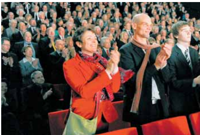
Stehende Ovationen: Nach der Premiere von „Zigeunerjunge“ jubelten die Besucher mit einem Lächeln im Gesicht.