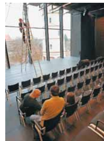
Platz in der Studiobühne: Auch ohne Aufführung prima Ausblick.