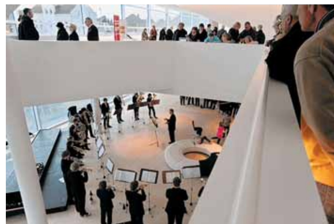
Das Foyer klingt: Volles Haus beim Besuchertag gestern. Hier blicken die Zuhörer auf das Blechbläserensemble der Kreismusikschule.