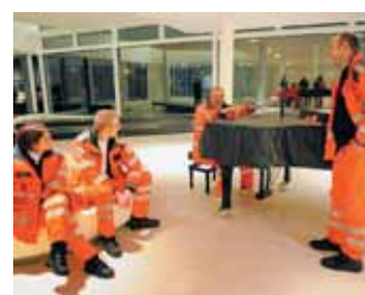
In die Tasten gegriffen: Die Sankt-Elisabeth-Kirche stimmte sich am Flügel im Erdgeschoss fröhlich ein.