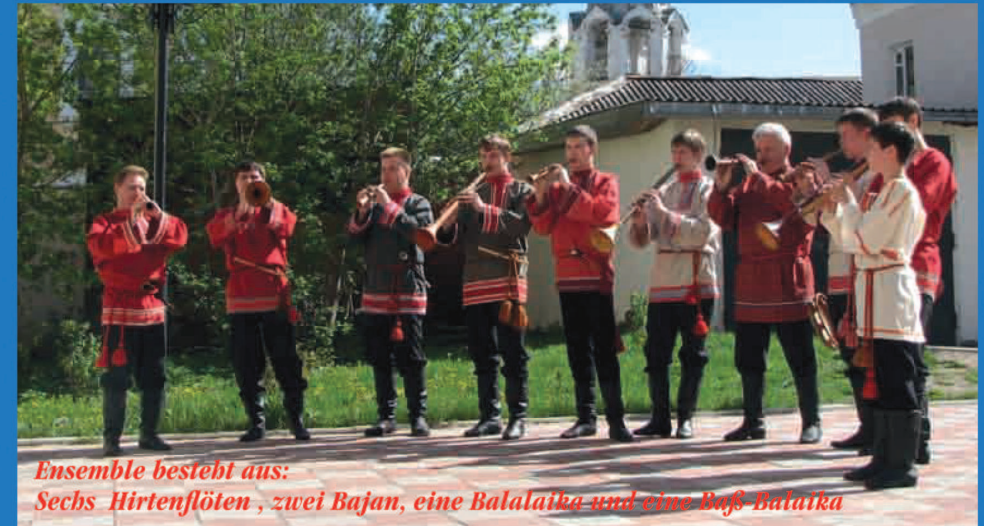
Ensemble besteht aus: Sechs Hirtenflöten, zwei Bajan, eine Balalaika und eine Baß Balalaika